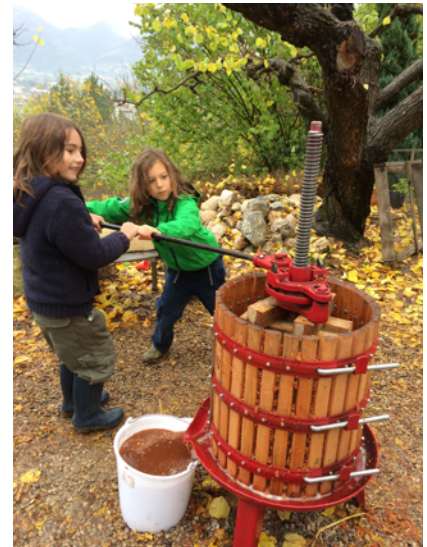
On met la « bouillie » dans le pressoir, on tourne pour presser. Le jus coule.