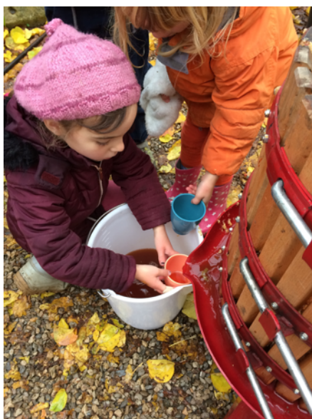
On goutte le jus de pomme frais.