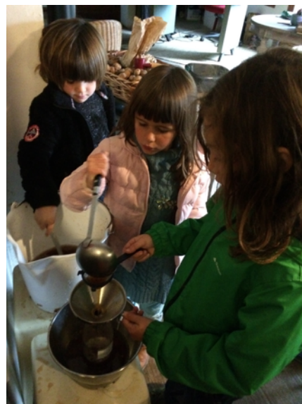
On met le jus de pomme en bouteille, et on met des bouteilles dans le stérilisateur