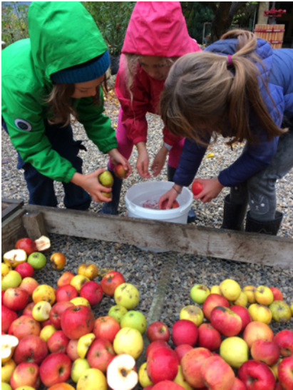
On lave les pommes

Par Perle Mathevet et Gaëlle Fourquet Dimino