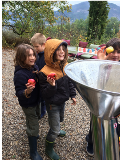
On met les pommes dans le broyeur pour faire de la « bouillie »